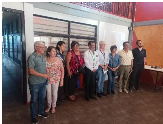
Dirigentes del Consejo Consultivo de Usuarios junto a Director y Subdirector del Hospital de Iquique

Asimismo, mencionar que el Consejo Consultivo perteneciente al Hospital Ernesto Torres Galdames, los Consejos de Desarrollo Local de la Región de Tarapacá y el Consejo de la Sociedad Civil, representan organizaciones de la sociedad civil que están vinculados con el Servicio de Salud Iquique, los cuales son representados mediante directivos dentro del ámbito territorial, interactúan entre sí, donde se logra recoger y considerar ciertas demandas, además de propuestas de la población y/o comunidad para tener una mirada más global de las diferentes problemáticas que afectan a la comunidad.